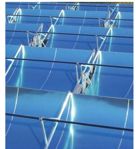
Das Produkt des Preisträgers: Hocheffiziente Parabolrinnenkollektoren für Temperaturen über 180°C.

Der diesjährige RIO Innovationspreis geht nach Aachen. So viel sei hier schon verraten. Der Preisträger: Ein echtes Produkt des Hochschulstandortes, ein Spin-Off der high-tec Forschung.