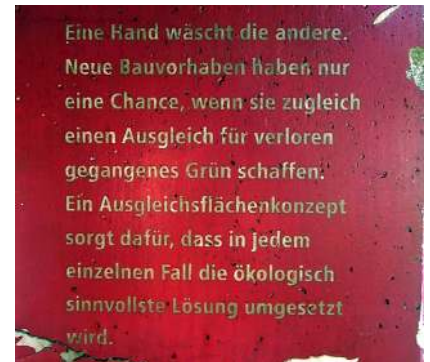
Inscription einer ÖSZ-Steine im Park.

mehr als 60% der jetzigen Grünfläche "Park Altes Klinikum" verkauft werden müssen, oder ob der AMB Generali nicht ein wesentlich kleinerer Teil reichen