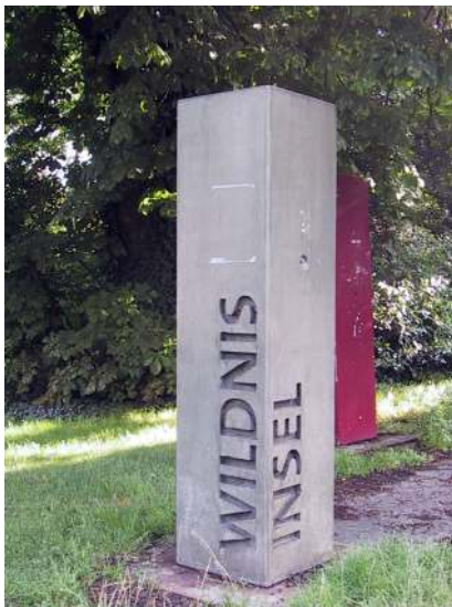
Eben noch ein Leuchtturmprojekt der Ökologischen Stadt der Zukunft (ÖSZ), bald Bauland.

Die Stiftung arbeitet seit vielen Jahren daran, die Grünfläche "Park Altes Klinikum" möglichst zu erhalten. Die bis vor wenigen Monaten noch im Konsens mit der Stadt durchgeführten und geplanten Aktionen wurden durch den Verkaufsbeschluss des Rates der Stadt nunmehr plötzlich torpediert.