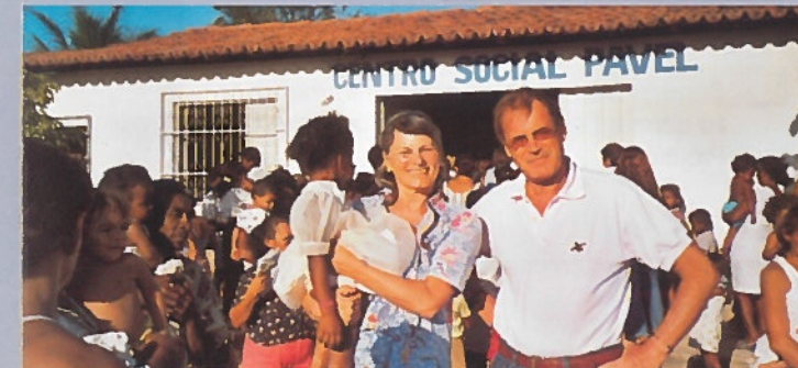
Brasilienhilfe: Hilfe zur Selbsthilfe