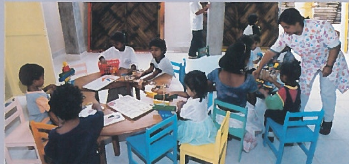
CRN - Ernährungszentrum in Ecuador

Der Verein leistet zum Beispiel Hilfe für obdachlose Frauen und führt Maßnahmen zur Verbesserung der Umwelt und des Lebensumfelds durch.