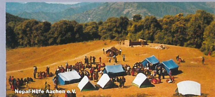
Nepal-Hilfe Aachen e.V.

Unternehmer und ihre Entwicklungsprojekte