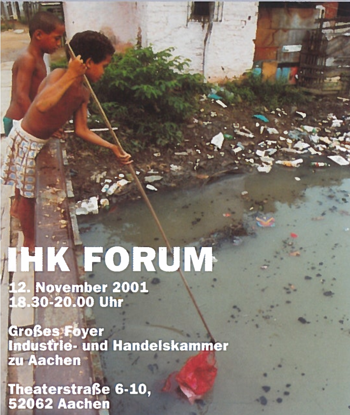
Pontes do Amor e.V. in Brasilien

Global-Player - das sind nicht nur Großkonzerne wie Nestlé, Unilever oder DaimlerChrysler. Das sind auch zahlreiche mittelständische Unternehmen aus dem Kammerbezirk. Märkte in Lateinamerika, Asien oder Afrika sind für sie von hoher strategischer Bedeutung. Die Präsenz in Entwicklungsländern bedeutet für Unternehmen mehr als den Verkauf von Waren und Dienstleistungen. Durch Niederlassungen im Ausland entstehen dort auch soziale Bindungen. Vielfach werden von den Unternehmern aus gesellschaftlicher Verantwortung mit großem persönlichem Engagement die sozialen und ökologischen Bedingungen in den Entwicklungsländern durch beispielhafte Projekte verbessert.